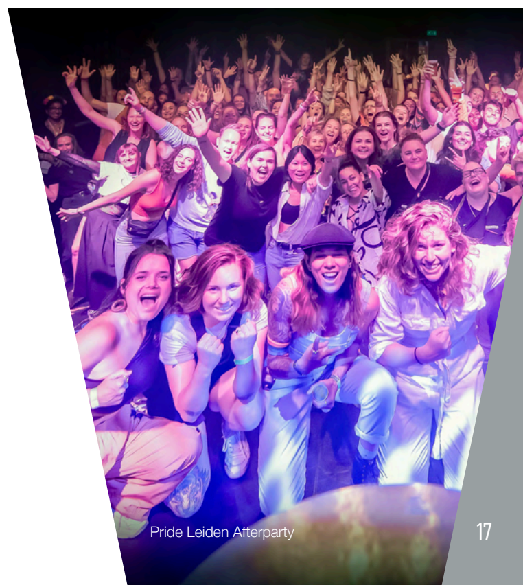
Pride Leiden Afterparty

De actieve aandacht voor het onderwerp heeft in de kantoorstaf en in de Raad van Toezicht geresulteerd in een grotere diversiteit en een groter aantal mensen met een migratieachtergrond. De komende jaren willen we ook binnen het totale eigen personeelsbestand, met name de frontstage crew en de vrijwilligers zorgen dat we een betere afspiegeling zijn van de maatschappij.