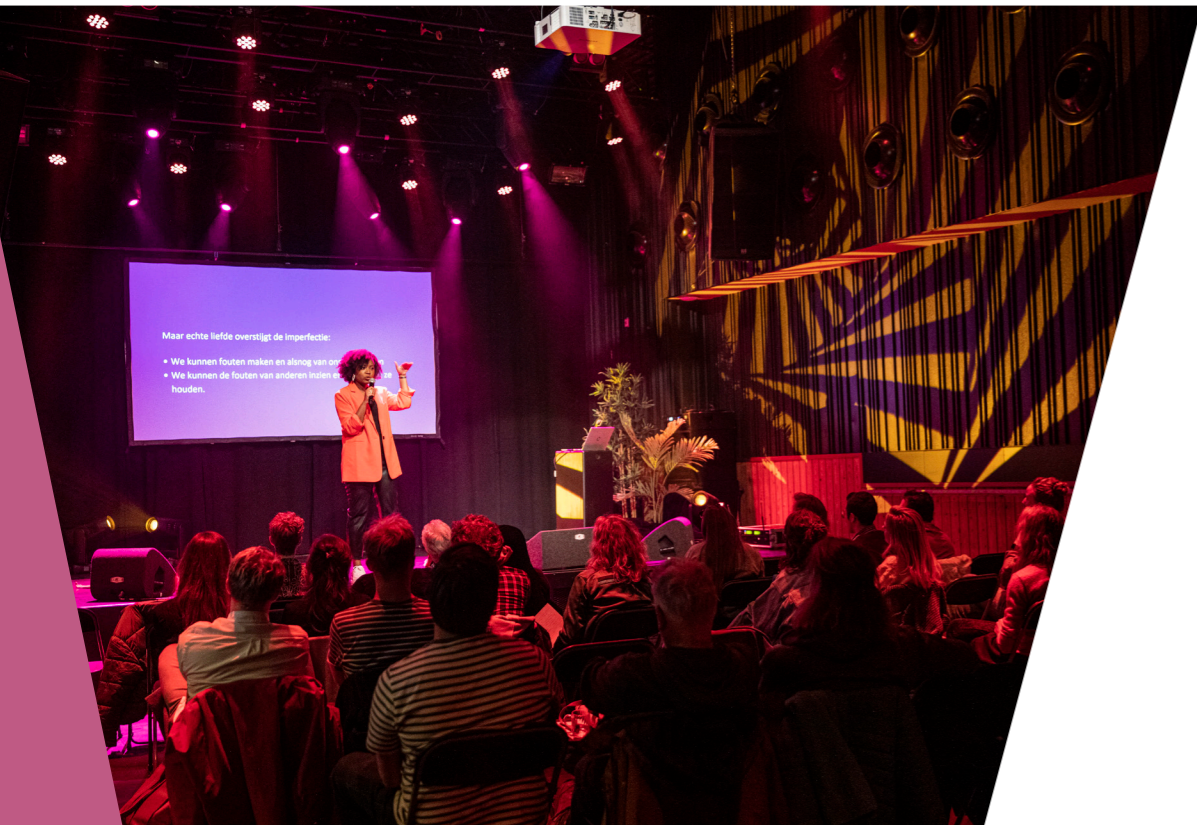
The School Of Life (Eus Straver)

Naast muziek streven we naar een bredere cultuurprogrammering, van spoken word met Mensen Zeggen Dingen tot literaire talkshows, en van filmvertoningen tijdens het Leiden International Film Festival tot het hosten van een randprogramma tijdens documentaire festival Leiden Shorts.