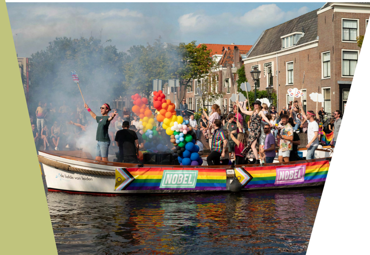
Canal Pride (Gijs Westerduin)

De Nobel is deelnemer aan het Green Stages programma. In het kader van energiebesparing is de kachel in 2023 zoveel mogelijk uitgelaten en wordt er in het pand gebruik gemaakt van slimme ledverlichting met bewegingssensoren. Het dak van de Nobel ligt vol met zonnepanelen en de overgebleven ruimte op het dak is bedekt met sedum. Dit groene dak is goed voor het milieu en de biodiversiteit. Daarnaast houdt het sedum de temperatuur op het dak relatief laag, waardoor de zonnepanelen die op het dak liggen een optimaal rendement kunnen halen. Verder gebruikt de Nobel standaard vegetarische catering voor artiesten.