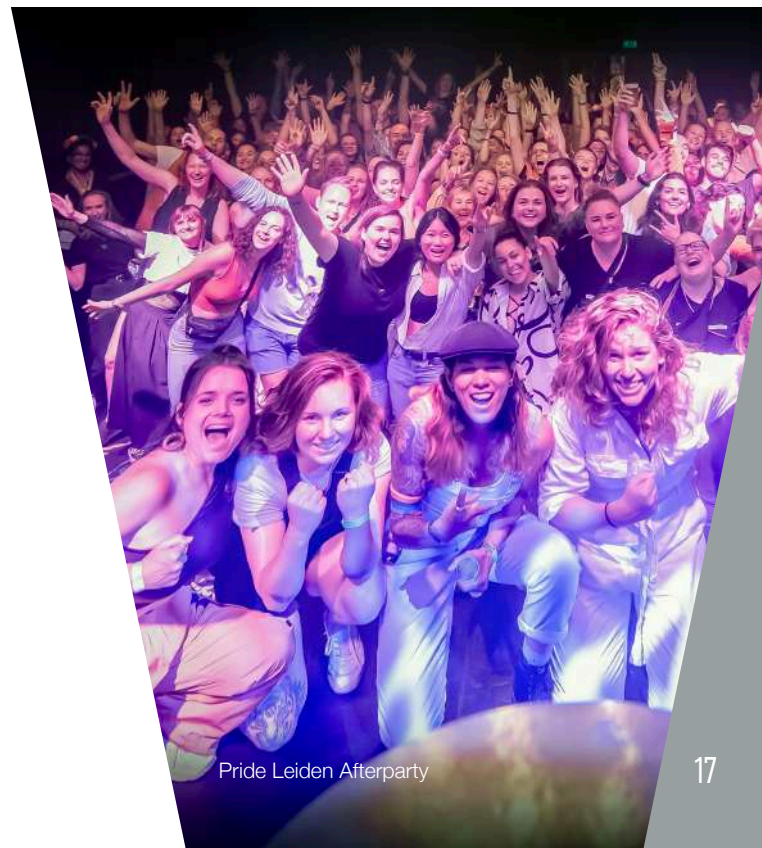
Pride Leiden Afterparty

De actieve aandacht voor het onderwerp heeft in de kantoorstaf en in de Raad van Toezicht geresulteerd in een grotere diversiteit en een groter aantal mensen met een migratieachtergrond. De komende jaren willen we ook binnen het totale eigen personeelsbestand, met name de frontstage crew en de vrijwilligers zorgen dat we een betere afspiegeling zijn van de maatschappij.