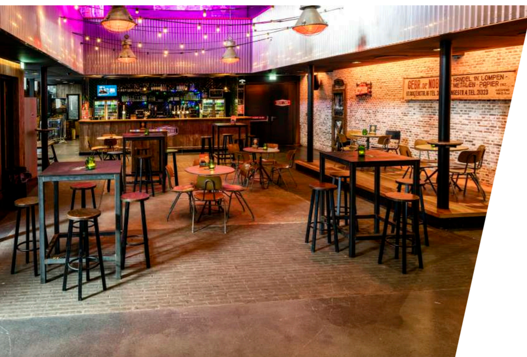
De nieuwe Foyer zonder de grote trap

In het pand zelf zijn tijdens Corona de nodige verbouwingen gedaan die de Nobel nieuwe mogelijkheden heeft gegeven voor de exploitatie van het pand. In februari 2022 is de Nobel overgestapt van de bemande garderobe naar lockers. Dit gaf betere mogelijkheden voor de doorloop tussen de verschillende ruimtes en verminderde drukte in de foyer tijdens events.