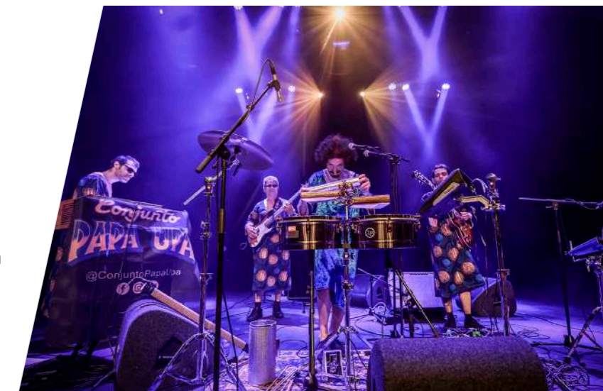
Conjunto Papa Upa trad op tijdens het Peel Slowly and See Festival

Om naast artiesten en musici ook organisatoren in Leiden meer mogelijkheden te geven heeft de Nobel nieuwe aantrekkelijke voorwaarden voor lokale organisatoren opgesteld. Nieuwe organisatoren kunnen op deze manier zonder veel financieel risico nieuwe ideeën uitproberen in de Nobel. De avonden worden meer ingezet als samenwerking en met begeleiding van het programma- en marketingteam van de Nobel.