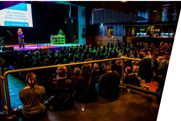
Pechakucha-avond in de Grote Zaal

Naast de muziekprogrammering organiseerde Pechakucha Leiden twee avonden in de Grote Zaal. PechaKucha is een van oorsprong Japanse presentatievorm waarbij iemand zijn/haar verhaal vertelt in 20 beelden, waarbij elk beeld 20 seconden wordt vertoond.