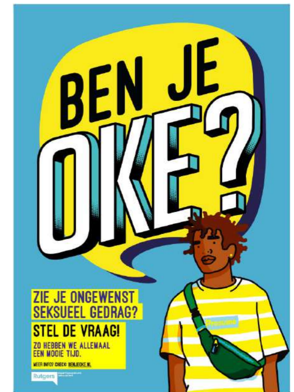
Ben je Oke? poster

Vanuit het personeel is daarna een werkgroep opgericht die dit thema samen met het MT verder gaat ontwikkelen binnen de Nobel. Een van de onderdelen daarvan is het voeren van de Ben je Oke? Campagne die als doel heeft om meer bewustwording onder het publiek te creëren. Daarnaast staan ook (het communiceren van) de huisregels en het invoeren van genderneutrale toiletten op de agenda.