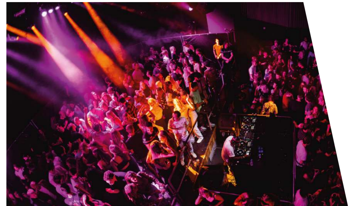
Dansen Bij Gebr. de Nobel

In Leiden is meer aanbod gekomen in het nachtleven, o.a. met de opening van Club Kiki in 2021 en de Wibar in 2019. Enerzijds is er daardoor wat meer concurrentie onderling, maar voor het nachtleven in Leiden is dat een positieve impuls voor de lange termijn. De Nobel is i.s.m. SPOT Leiden een onderzoek gestart naar het Leidse Nachtleven. De resultaten daarvan komen in de loop van 2023.