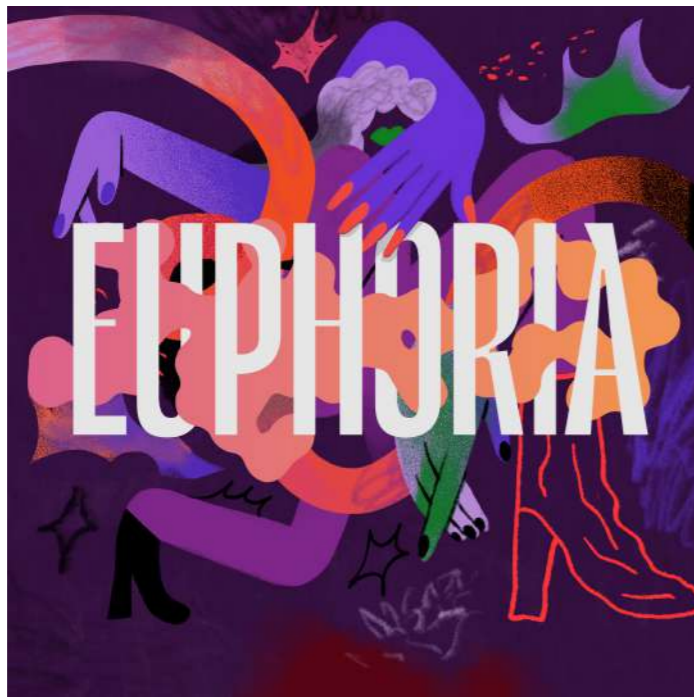
de nieuwe LGBTQI+ dansavond Euphoria

De Nobel zal meer gaan werken met eigen concepten; Hey Ya! om de top van de Nederlandse hiphop artiesten naar Leiden te halen; Nobel Discover voor opkomende indie/alternative acts; Nobel Electronic voor (live) melodic house & techno; en Euphoria voor de LGBTQI+ doelgroep in de stad en regio.