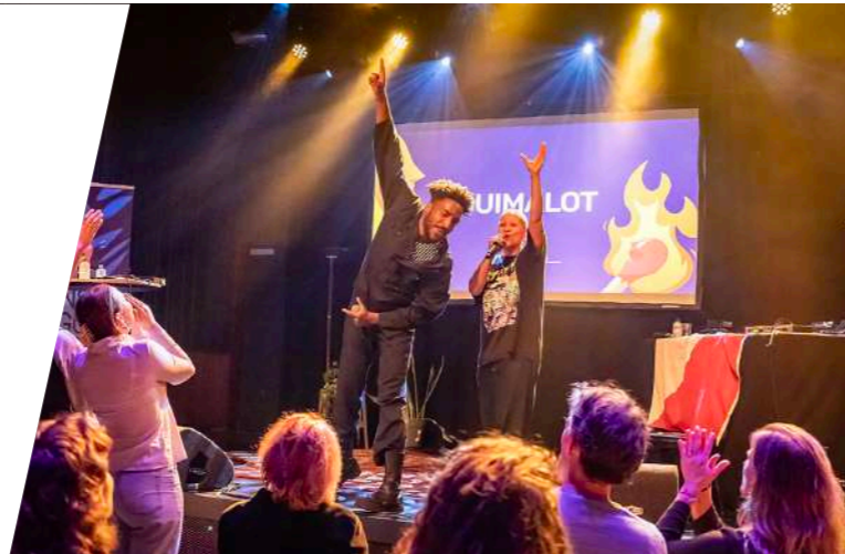
Spoken Word tijdens Mensen Zeggen Dingen

Nieuw in de programmering waren twee Spoken Word avonden gehost door collectief Mensen zeggen Dingen. Daarbij kreeg ook lokaal talent de mogelijkheid om tijdens het open podium Tapschrift op te treden.