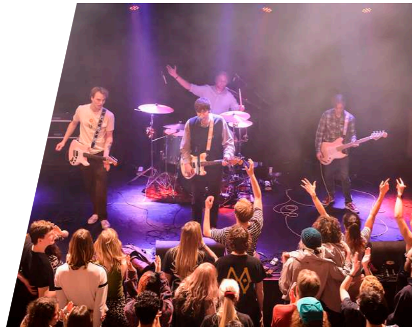
3voor12 presenteert lokaal talent

Nieuw in 2022 was de samenwerking van de Nobel met Leidse Geluiden, een collectief van Leidse muzikanten in de Jazz/Funk/Soul genres. Zij verzorgden vanaf oktober één keer in de maand de programmering op de zondagmiddag.