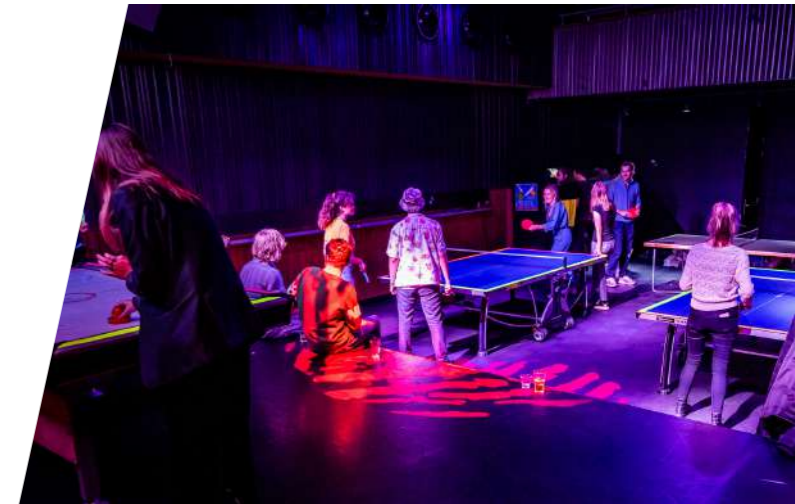
Pingpongen tijdens The Palace

In het najaar organiseerde de Nobel een aantal edities van The Palace, een op de jaren tachtig geïnspireerde avond met Arcade Games, ping-pong tafels en 80's muziek.