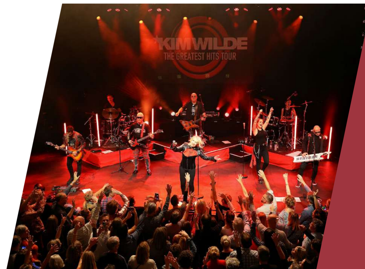
Kim Wilde deed in 2022 opnieuw de Nobel aan

In 2022 zijn in totaal 105 concertprogramma's gerealiseerd, ten opzichte van 107 in 2019. Op pagina 16 staat een overzicht van de aantallen concerten in de verschillende genres.