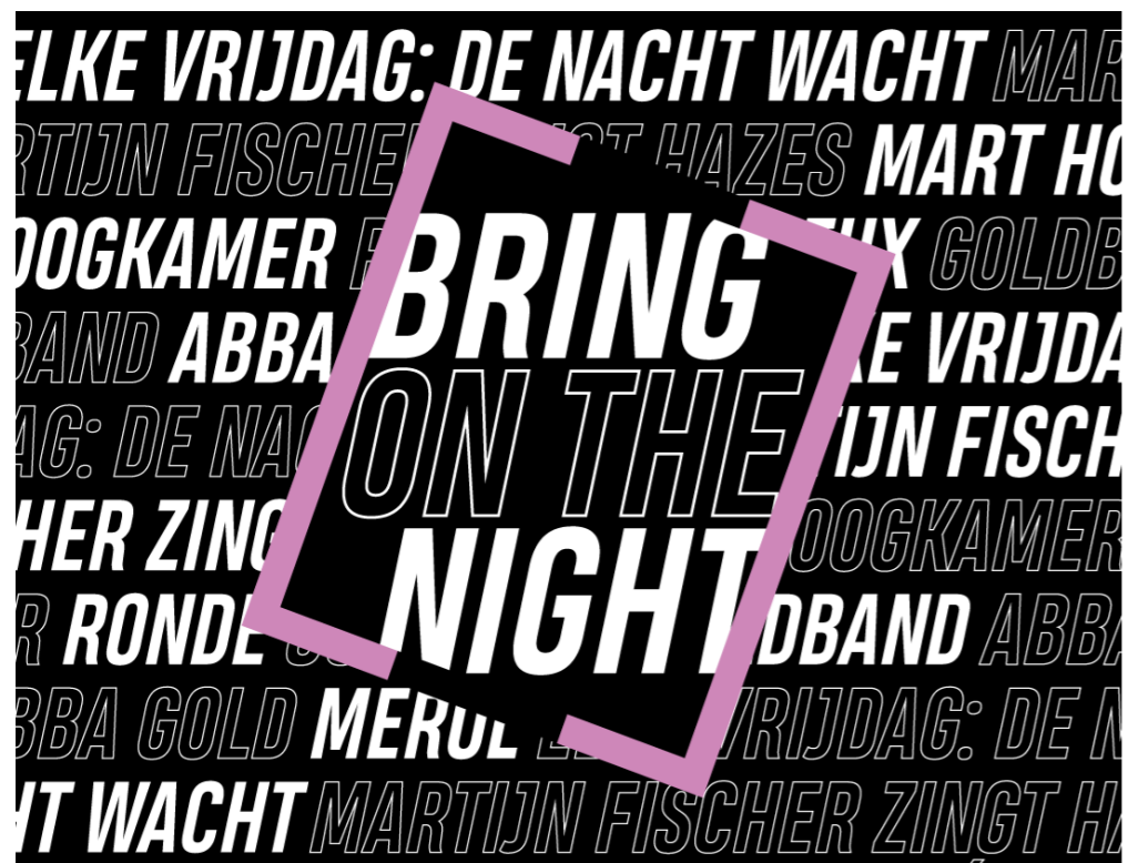
Bring on the Night campagne uiting

Met de Bring on the Night campagne wilde de Nobel de aandacht vestigen op de sociale waarde van de nachtcultuur, die bestaat uit het bieden van een plek waar ideeën en creativiteit uitgewisseld en ontwikkeld kunnen worden en waar bezoekers hun identiteit kunnen ontdekken, vormen en uiten.